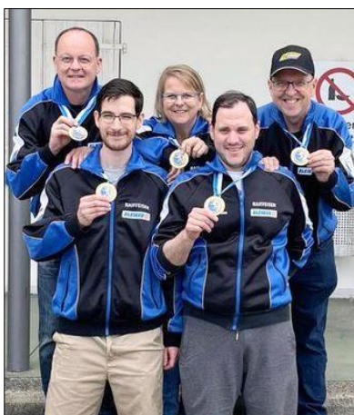
Bilder (v.l.). 14. Titel für Höri (Feld A)–