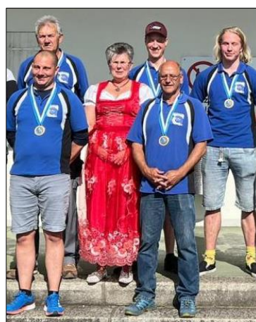
Stadel zum ersten Mal Meister (D) –